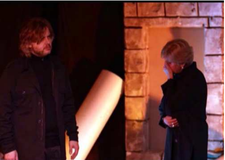
Alceste o la recita dell'esilio di Giovanni Raboni