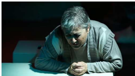
Sotto un ponte lungo un fiume di Luigi Lunari