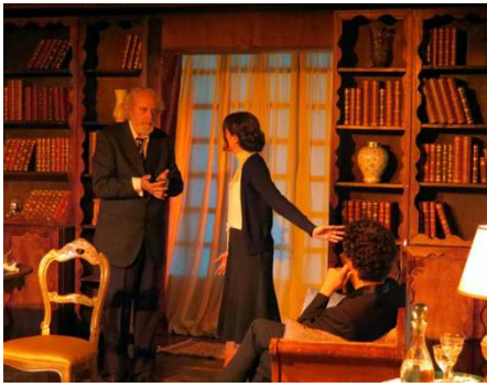
Il visitatore di Eric Emmanuel Schmitt